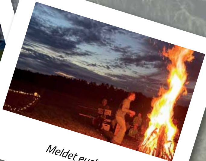
Meldet euch an!