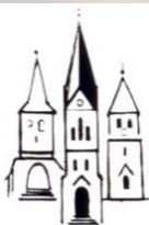
Evang.-luth. Kirchengemeinde St. Nikolai Neuendettelsau